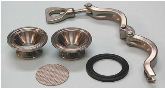
エレメント目開き: 75 \mu (#200メッシュ) エレメント材質: SUS316L パッキン: バイトン