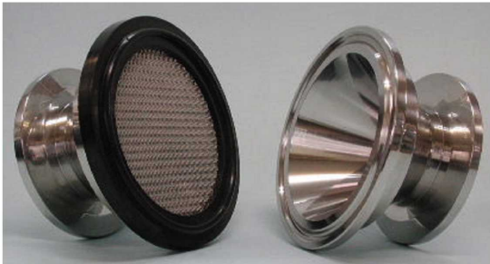
エレメント目開き: 100 \mu (#150メッシュ) エレメント材質: SUS316L パッキン: バイトン