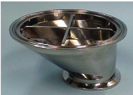
接続部:IDF2Sヘルレル エレメント部:IDF4Sヘルレル