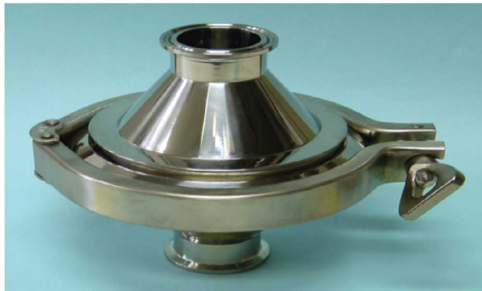
接続部: IDF1.5Sヘルール エレメント部: GAS100Aヘルール