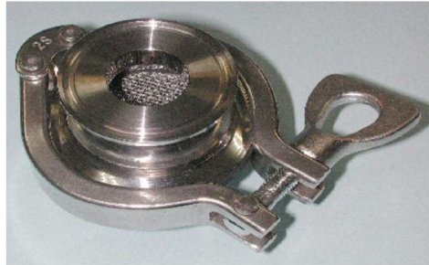
接続部: IDF1Sヘルール エレメント部: IDF2Sヘルール