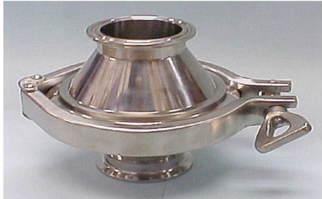
接続部: IDF2Sヘルール エレメント部: IDF4Sヘルール