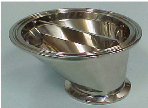
接続部:IDF2Sヘルレル エレメント部:IDF4Sヘルレル