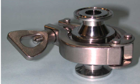
接続部: ISO10Aヘルール エレメント部: IDF1.5Sヘルール